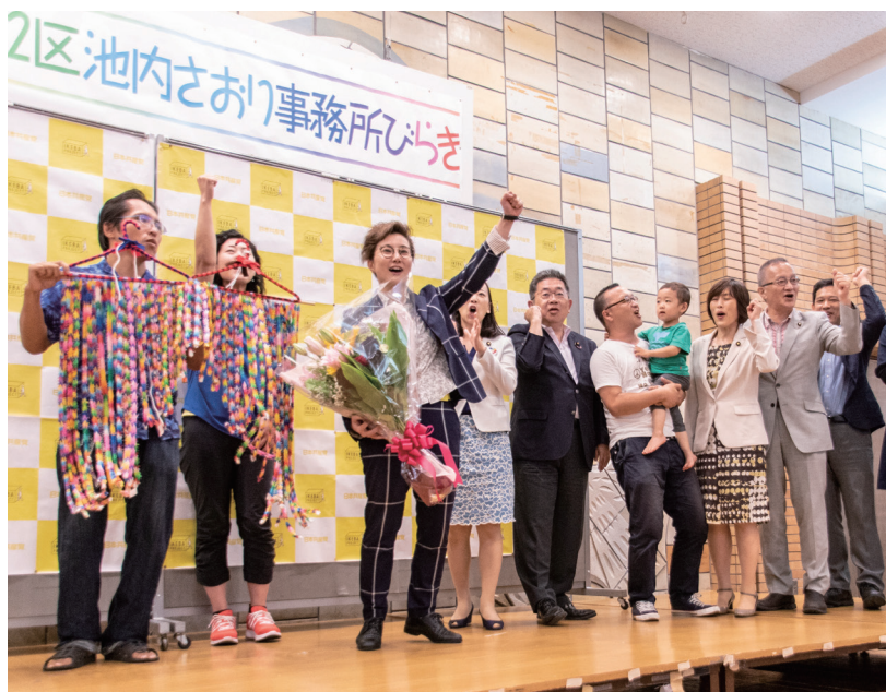
事務所開きで池内さおり前衆議院議員と参加者が奮闘を誓う

事務所開きでは日本共産党都委員会を代表して田辺良彦書記長が「暴走政治と正面から対決し、性暴力被害者らの声を届けてきた、都民にどうしても必要な議席。再び国会に送ってください。」と主催者あいさつ。